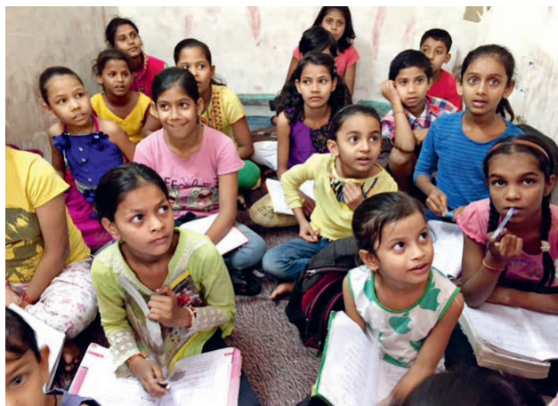
Unterricht in einem ASRA-Klassenzimmer

Im Namen der behinderten und benachteiligten Kinder und Jugendlichen dankt der Stiftungsrat Ihnen, dass Sie unser Hilfswerk auch im vergangenen Jahr wieder unterstützt haben. Mit Ihren Beiträgen an die ASRA Stiftung Schweiz und dadurch an den ASRA Trust in Delhi haben Sie das Leben vieler Kinder positiv beeinflusst.