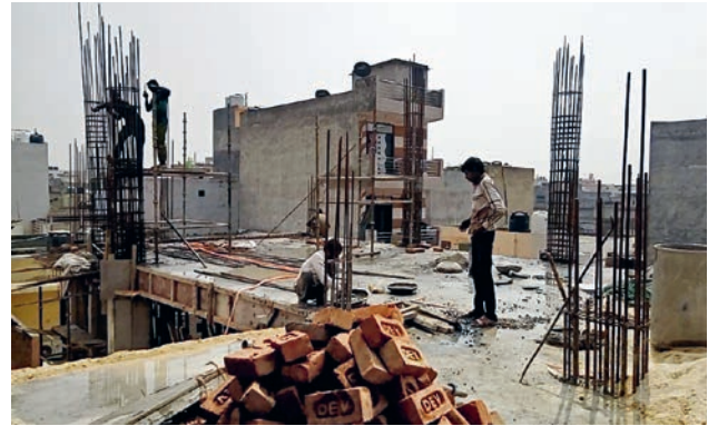
Arbeiten auf dem Dach

mit welcher Geschwindigkeit und mit welcher Qualität dieser Neubau und die Anpassungsarbeiten im angrenzenden ARTC durchgeführt werden.