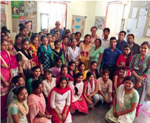
Lehrerinnen-Team CBR (Community Based Rehabilitation)