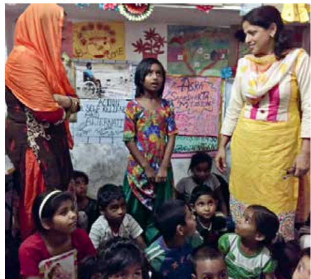
Schulklasse in Slum Community